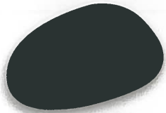
Negro mate 424 brillante 451