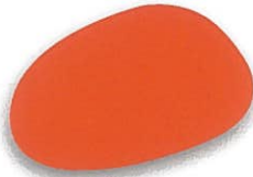
Azarcon mate 403 brillante 453