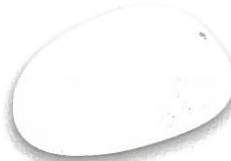
Blanco mate 460 brillante 455

STOP ANTICORROSIVO es un producto formulado a base de Cromato de Zinc, y de resinas sintéticas de alta calidad. Recomendado para proteger superficies metálicas ferrosas de la corrosión, creando una barrera eficaz contra los agentes atmosféricos en interiores y exteriores.