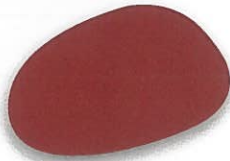
Rojo óxido mate 414 brillante 452