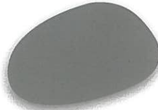
Gris mate 413 brillante 454