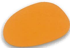
Amarillo caterpillar 456